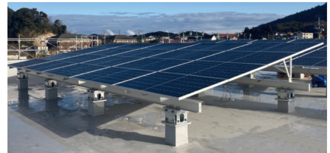
太陽光発電設備イメージ